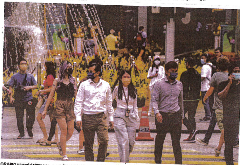
ORANG ramai tetap mengenakan pelitup muka semasa berada di Bukit Bintang, Kuala Lumpur semalam walaupun kerajaan tidak mewajibkan pemakaiannya di tempat terbuka.

“Paling penting, setiap rakyat perlu terus menjaga prosedur operasi standard (SOP) ditetapkan dan tidak mudah leka bagi memastikan negara mampu mengawal penularan drastik kes Covid-19 khususnya selepas Aidilfitri,” jelasnya.