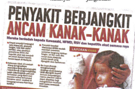
Laporan muka depan Sinar Harian pada Selasa.

Menurutnya, langkah disinfeksi atau nyahkuman permukaan yang tercemar juga dapat mengurangkan risiko jangkitan.