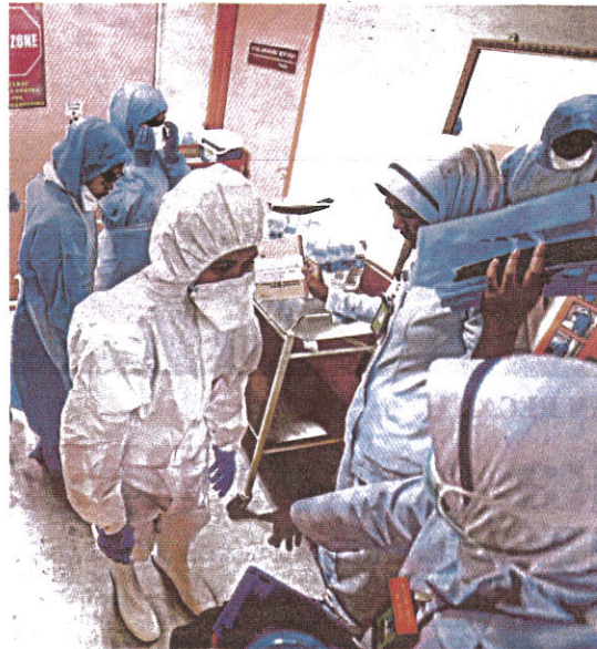
BETAPA mulia dan tingginya bakti seseorang jururawat kepada masyarakat.

Data sejarah menunjukkan bahawa jururawat Islam yang pertama bermula sejak zaman Rasulullah SAW apabila seorang tokoh Muslimah bernama Rufaidah binti Saad dilaporkan antara Muslimah terkehadapan dalam menghulurkan bantuan rawatan kepada pihak tentera yang mengalami kecederaan di